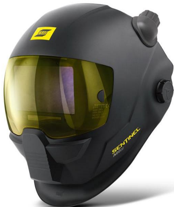
Sentinel A60 Air